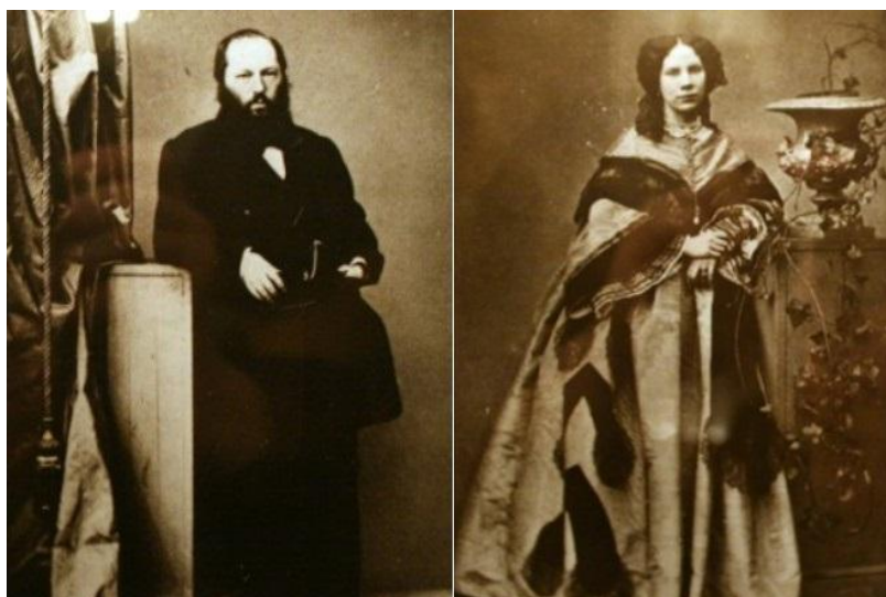
Афанасий Фет и Мария Боткина.